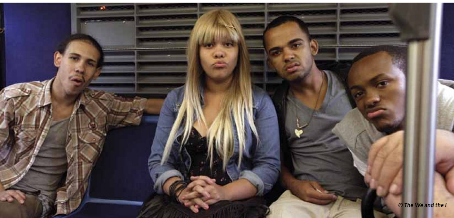
© The We and the I